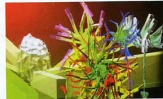
Fractal Flowers 2009