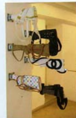
© Mihael Milunovic - La Guerre des Marques